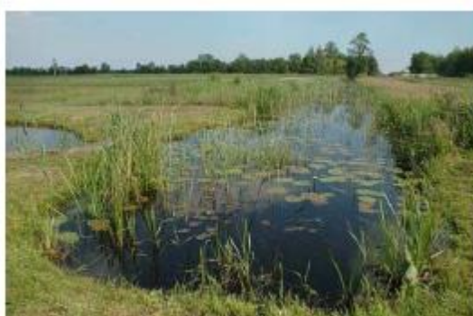
Leefgebied van platte schijfhoren