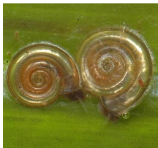
Platte schijfhoren